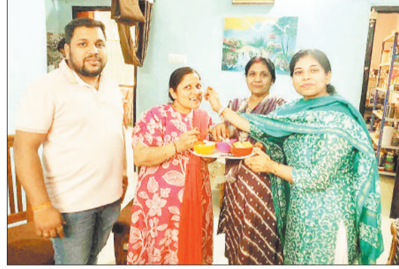
खुशियां मनाते परिजन।